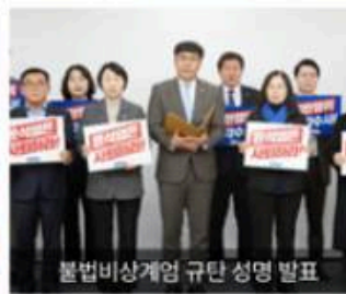
불법비상계엄 규탄 성명 발표