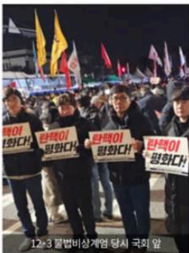
12·3 불법비상계엄 당시 국회 앞